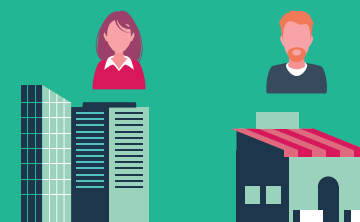
CLIENTS PROFESSIONNELS OU ENTREPRISES